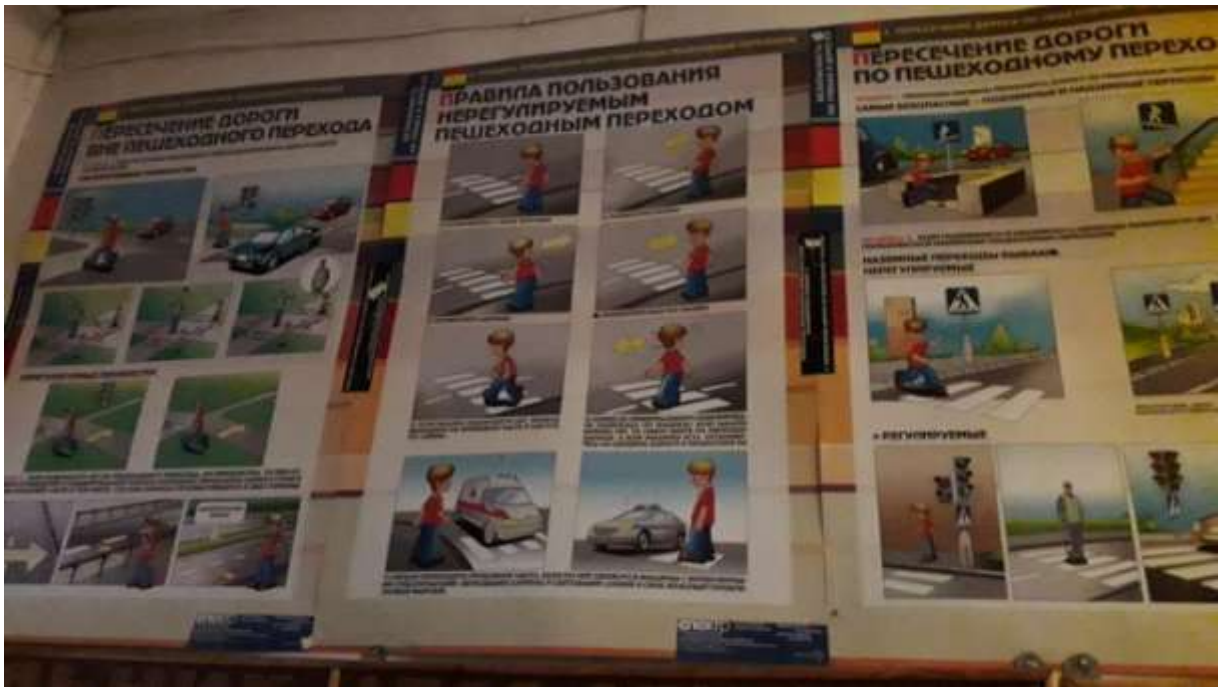
Стенд по ПДД (фото 2)