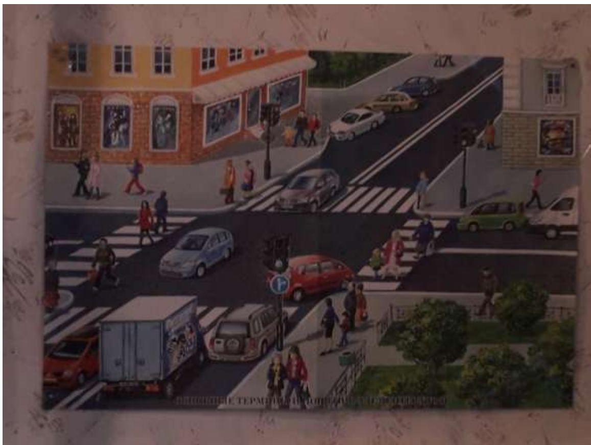
Уголок ПДД (фото 3)